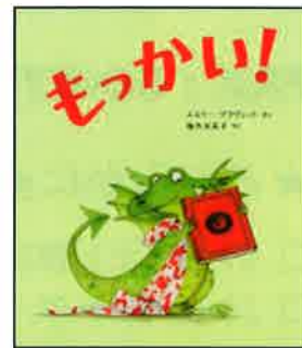
『もっかい!』福本友美子訳 フレーベル館 2012年

主催：国立国会図書館 国際子ども図書館／大阪府立中央図書館／一般財団法人 大阪国際児童文学振興財団 協賛：近鉄グループホールディングス株式会社/サントリーホールディングス株式会社/パナソニック株式会社/ 株式会社富士通システムズアプリケーション&サポート/ムサシ・アイ・テクノ株式会社