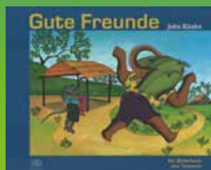
Gute Freunde John Kilaka/by Baobab Books, 2004