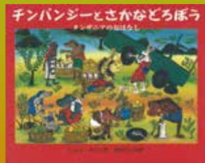
「チンパンジーとさかなどろぼう」 ジョン・キラカ/作 若林ひとみ/訳 岩波書店 2004年6月